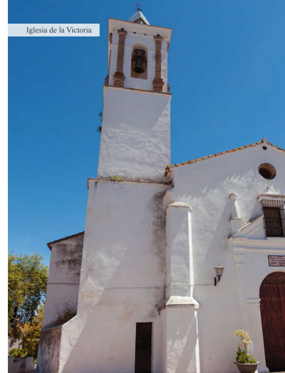
Iglesia de la Victoria

Continuando con el itinerario, son de enorme interés arquitectónico una serie de edificaciones domésticas de los siglos XVIII-XIX, que presentan una arquitectura con una serie de características propias: