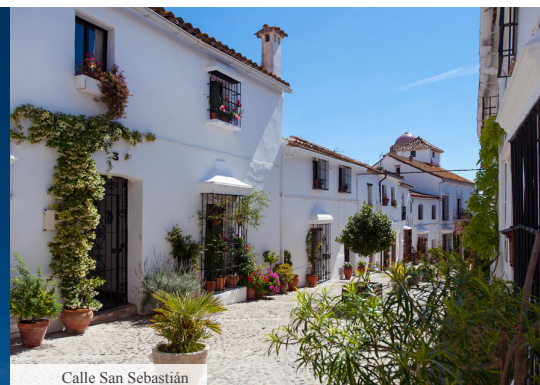
Calle San Sebastián