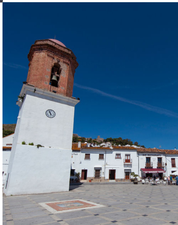
Plaza de la Constitución