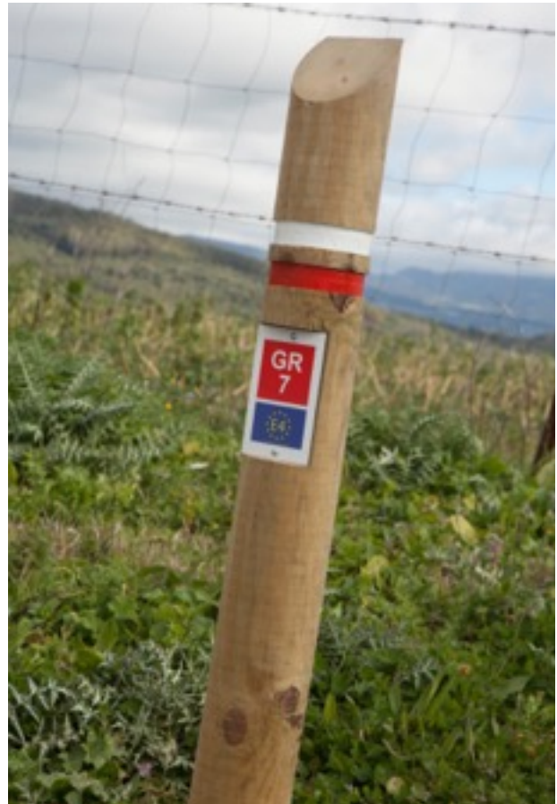
▲ Señalización del GR-7

desapareciendo para ir mezclándose con Encinas, Quejigos y Acebuches.