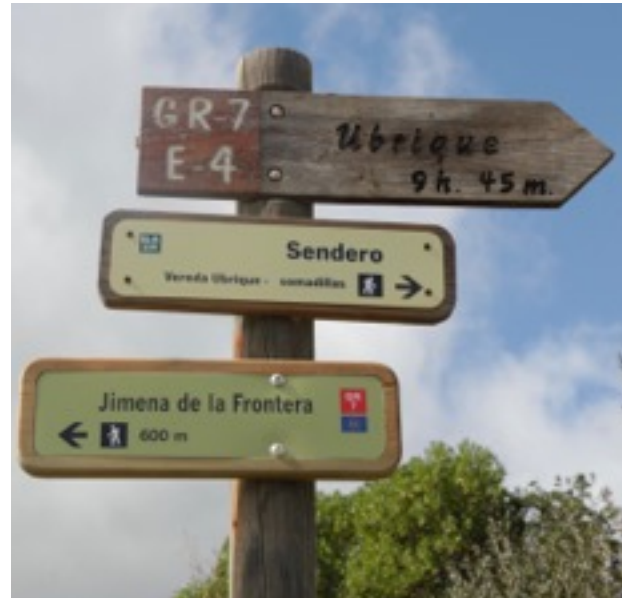
Señalización del GR-7 a su paso por Jimena de la Frontera

El sendero GR-7 (E-4) a su paso por la provincia gaditana cuenta con 9 etapas que en total suman aproximadamente 150 kilómetros: